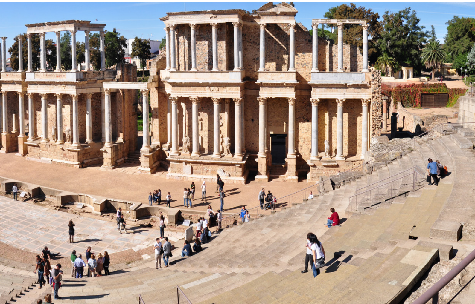
▲ メリダ古代ローマ劇場

旧ルネッサンス様式大学やフカレスの中庭など歴史的な建築でも開催されます。毎年6万人以上の人々が訪れるイベントで、7月に行われます。