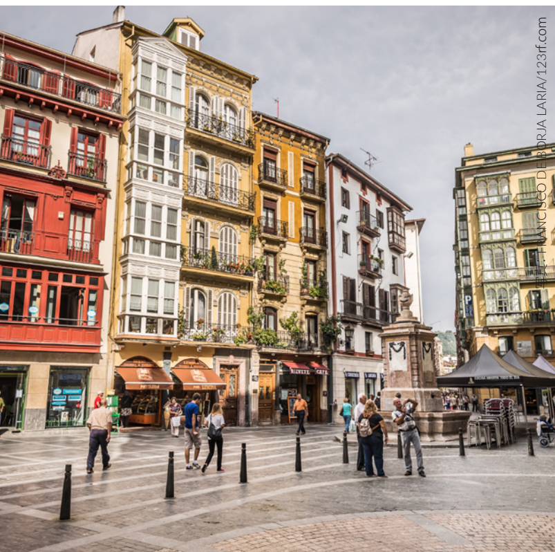
▲ 旧市街 ビルバオ