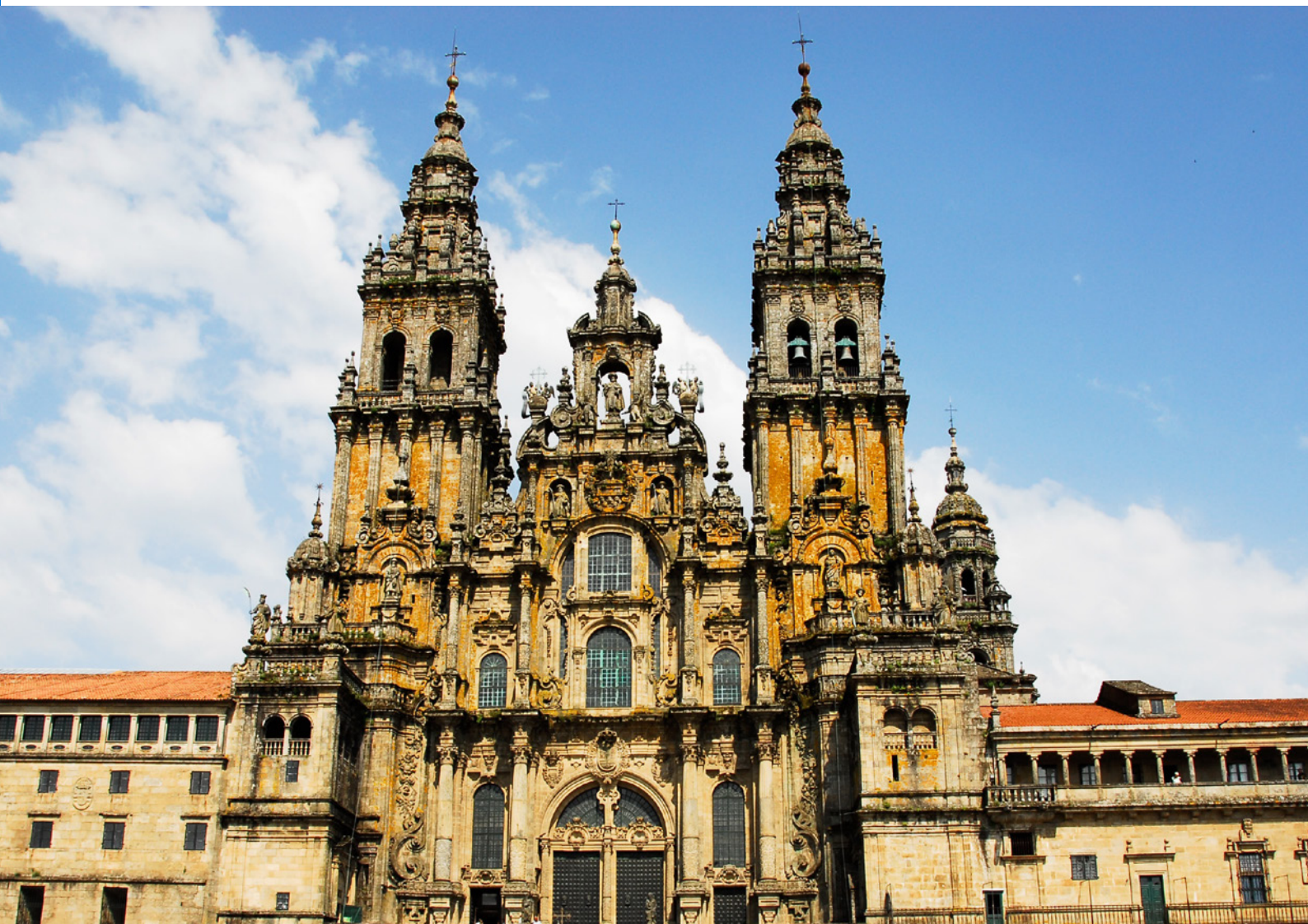
▲ サンティアゴ大聖堂 サンティアゴ・デ・コンポステーラ