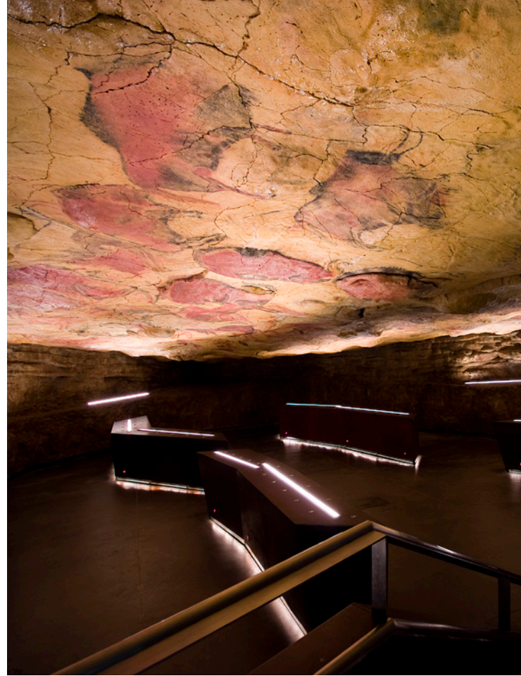
▲ ネオクエバ: アルタミラ国立博物館・研究センター サンティリャーナ・デル・マル、カンタブリア州