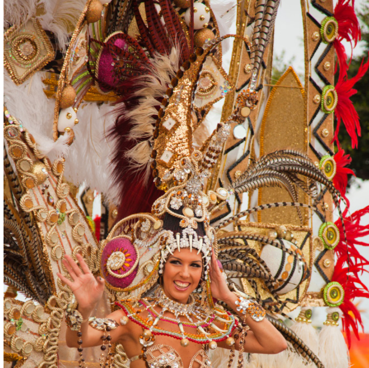
▲ テネリフェのカーニバル

聖週間の篤い信仰心は、四旬節の前に行われるカーニバルの祝祭的な雰囲気とは対照的です。カーニバルは明るく開放的でクリエイティビティに満ちており、音楽に合わせた幻想的なパレードで祝われます。世界的に有名なカーニバルは、サンタ・クルス・デ・テネリフェ(カナリア諸島)ですが、アンダルシア州や、カディスやアギラス(ムルシア県)でも素晴らしいカーニバルを楽しむことができます。