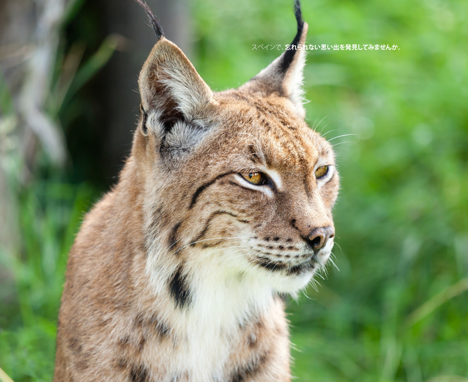
▲ イベリアオオヤマネコ ドニャーナ