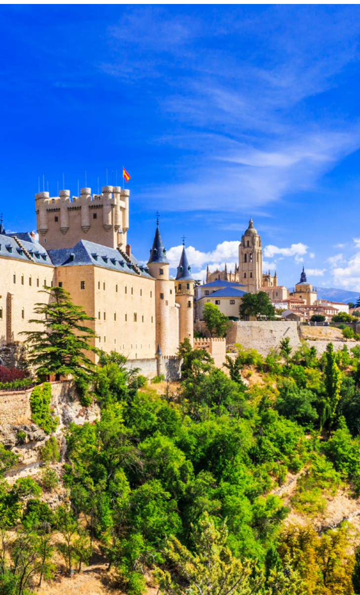
▲ セゴビアのアルカサル