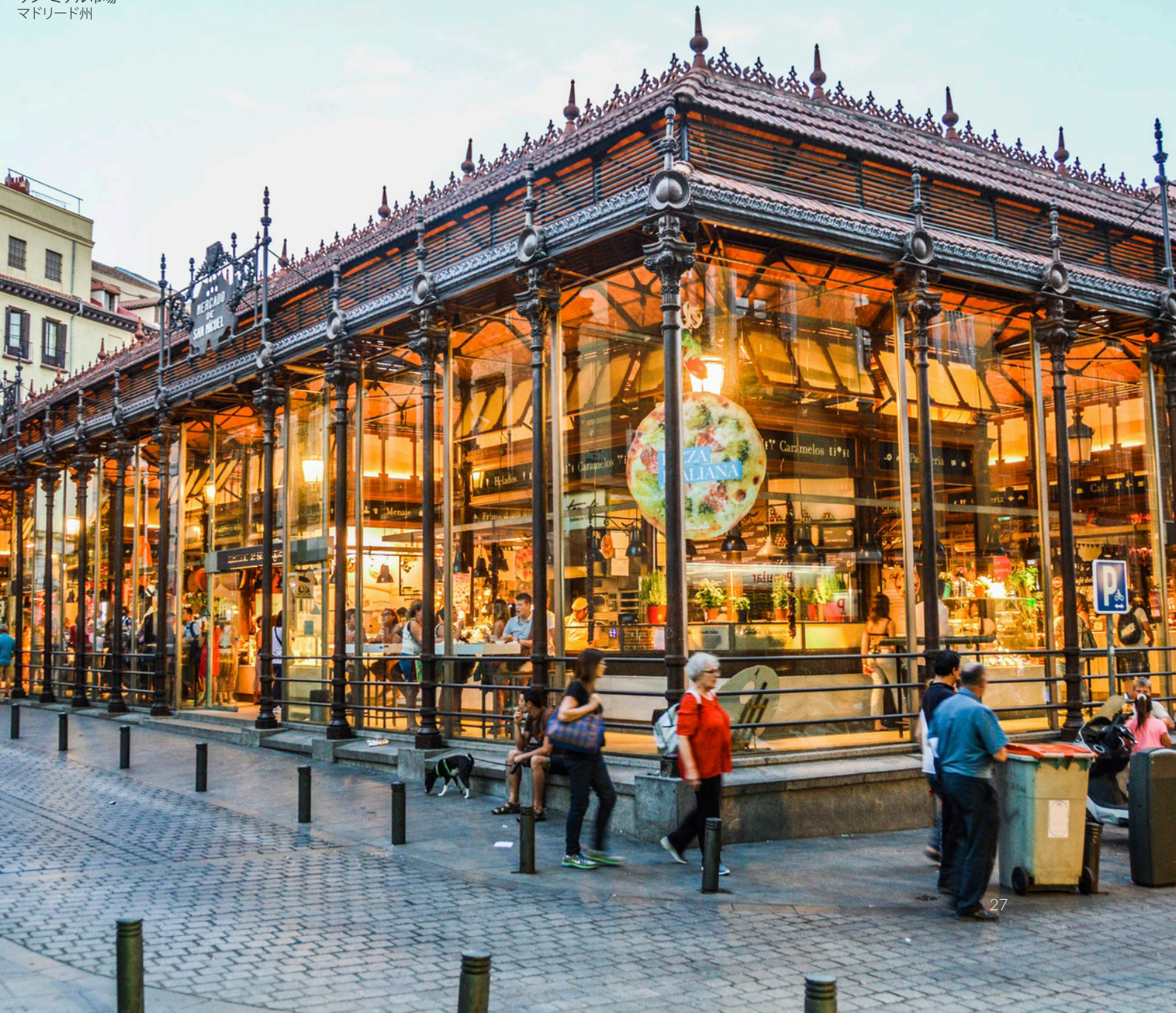
サン・ミゲル市場 マドリード州

スペイン料理の真髄を味わいたいのであれば、ぜひ街のマーケットを訪れるべきです。歴史あるマーケットの多くが、貴重な美食を体験できる場所として生まれ変わっています。マドリードのサン・ミゲル市場、バルセロナのボケリア市場、バレンシアの中央市場では、生演奏を聴きながら、ワインを片手に自慢のタパスをつまんだりすることができます。ぜひ地元の人々とともに楽しみましょう。視覚も味覚も大満足な、贅沢な時間が流れます。