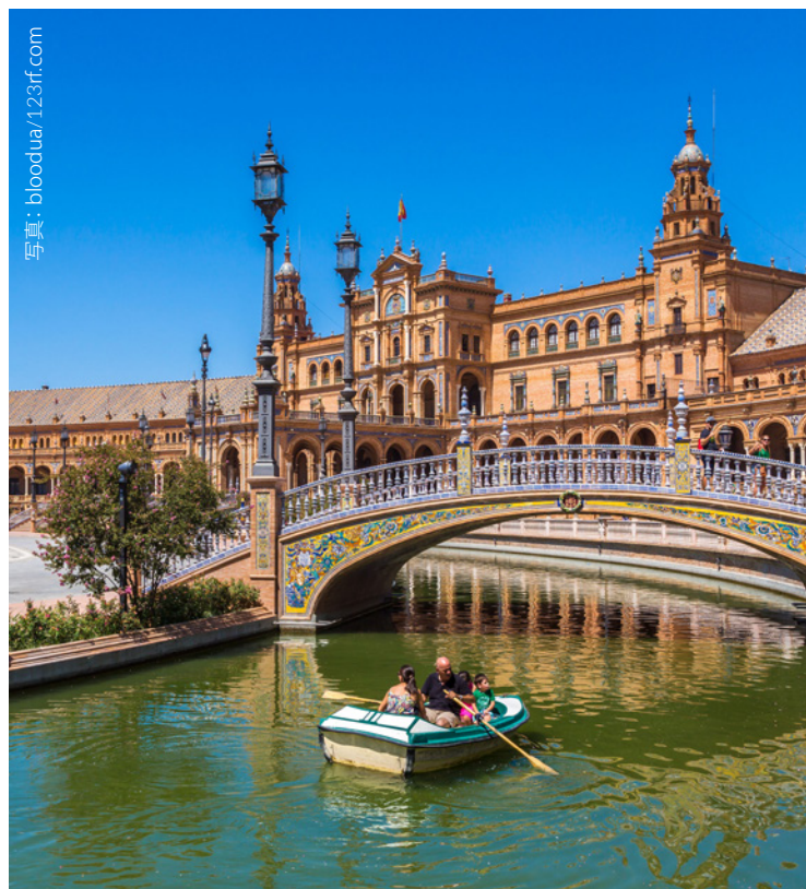
▼ スペイン広場 セビージャ州