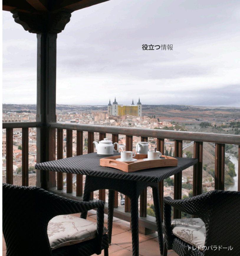
トレドのパラドール

スペインでは、ショッピングセンターや店舗の営業時間は長く、ほとんどの都市で、大型店舗やショッピングセンター