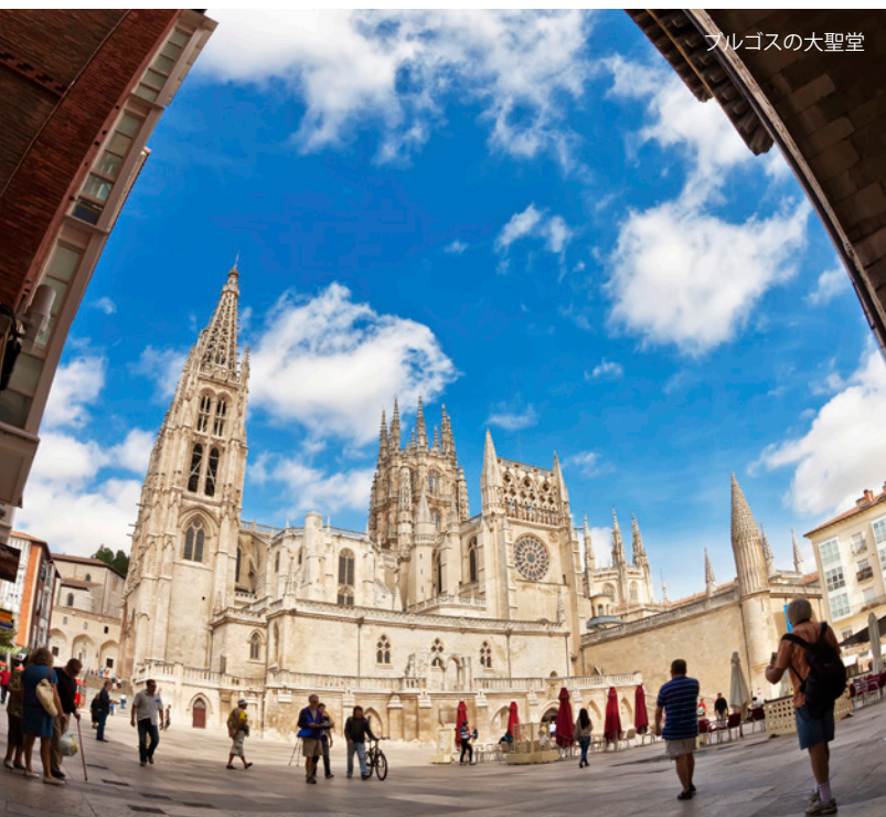
ブルゴスの大聖堂