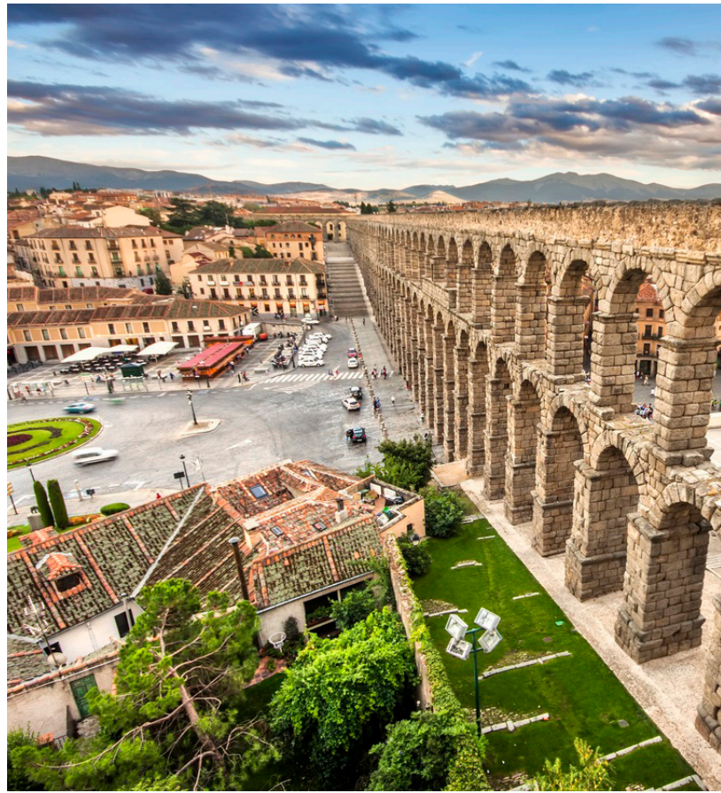
▲ セゴビアの水道橋