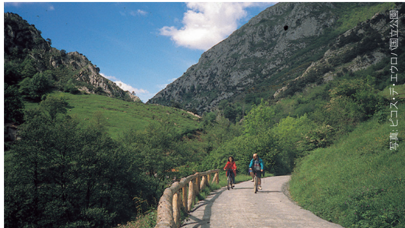
▲ 「緑の道」センダ・デル・オソ(熊の小道) アストゥリアス州

高山の中にある圧倒されるような湖や、モミとクロマツが生い茂る森へと通じる、さまざまなトレッキングコースが広がっています。ピレネー山脈最高峰