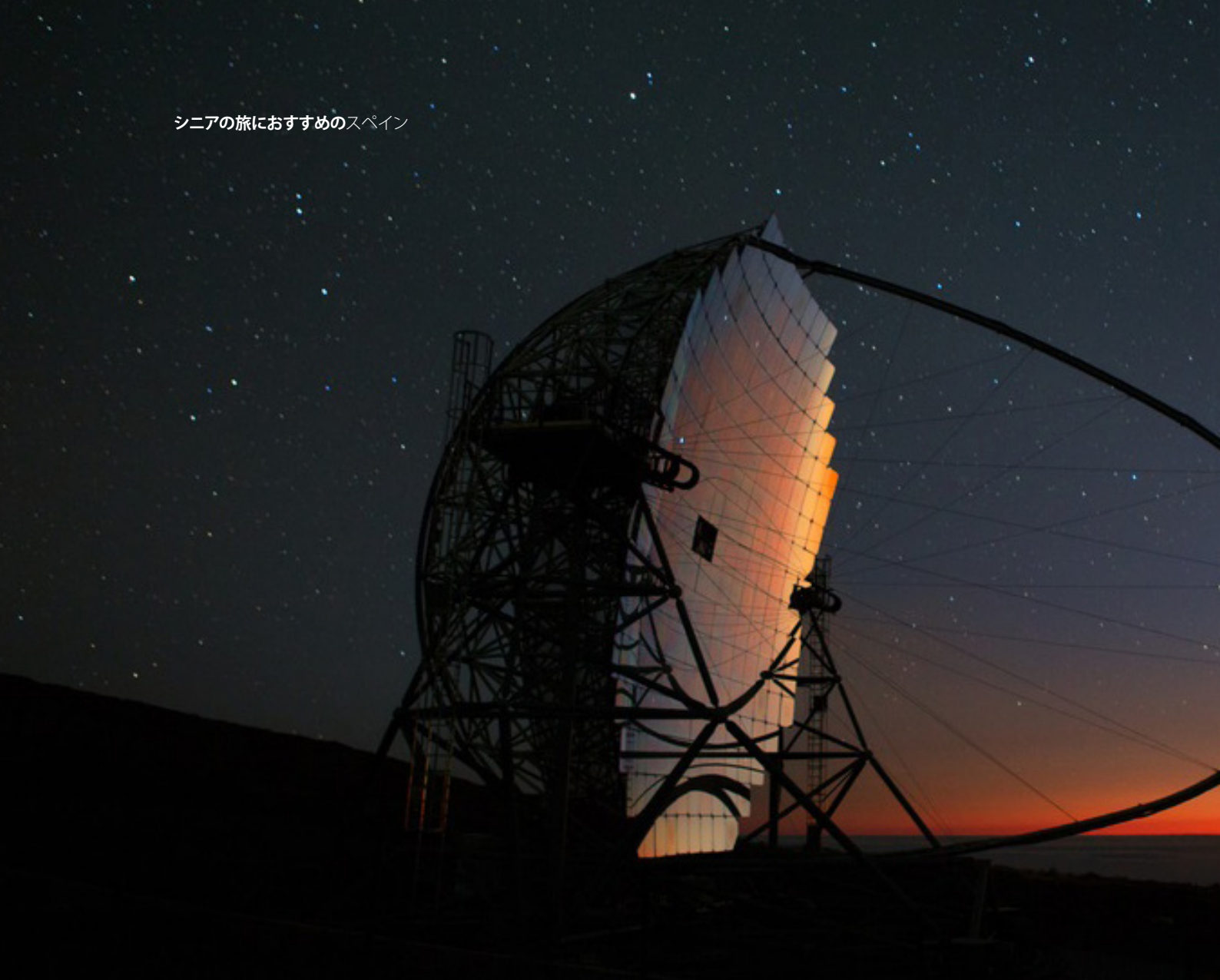
▲ ロケ・デ・ロス・ムチャーチョス 天文台 ラ・パルマ島