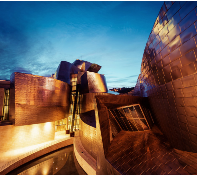
▲ ビルバオ・グッゲンハイム美術館