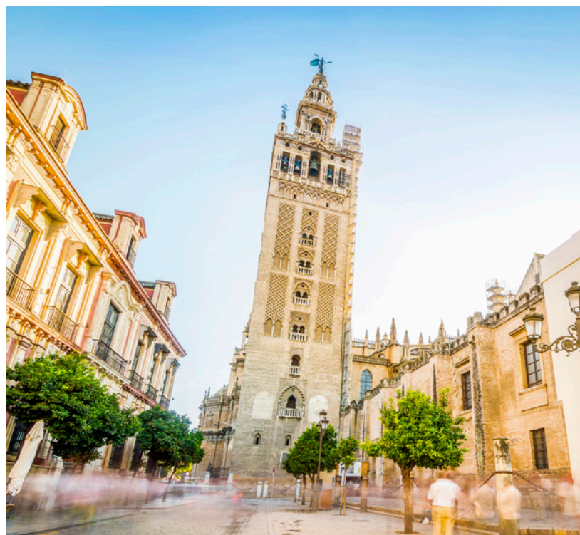
▲ ヒラルダの塔 セビージャ州