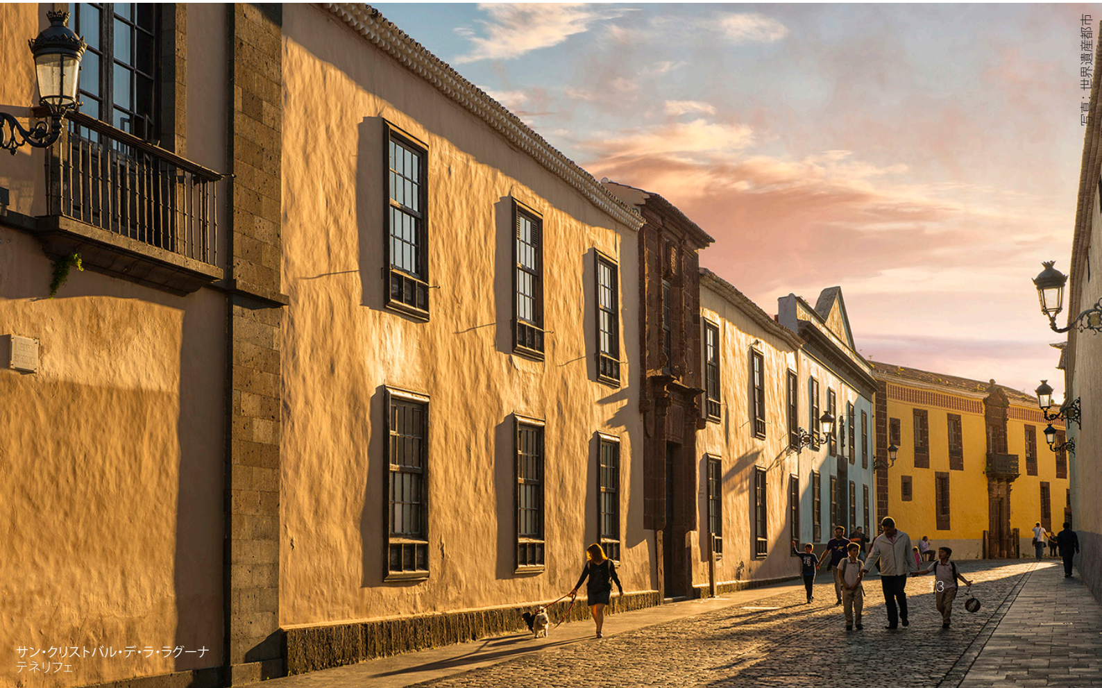
写真：世界遺産都市