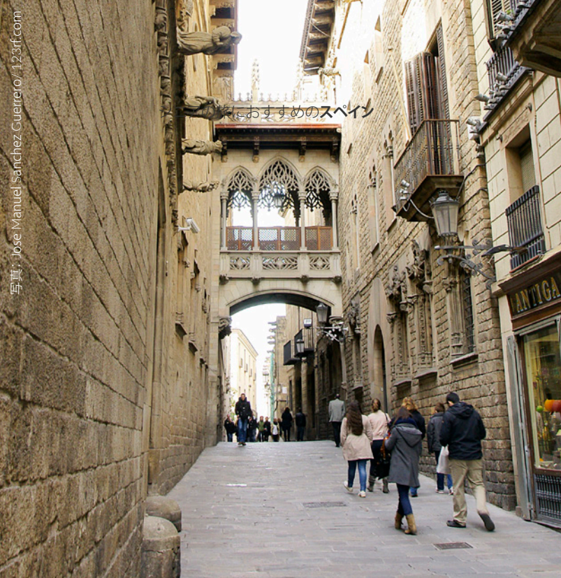
おすすめのスเปน